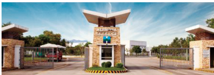
Heramosa Ecozone Industrial Park

電 気：敷地内変電所で69KVから34.5KVに降圧して供給 上 水：工業団地より最大15,000m 3 /日を供給 通 信：敷地内に光ファイバーを敷設