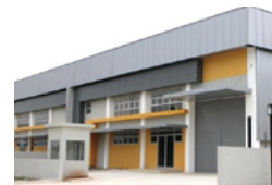
レンタル標準工場