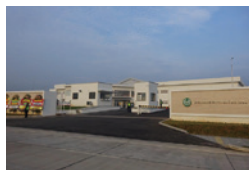
チカラン日本人学校