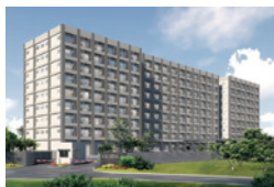
日本人家族向けサービスアパート